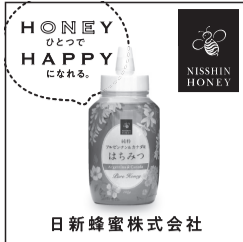
日新蜂蜜株式会社

中部飲食料新聞社ホームページ http://chuin.net/ 【業界情報発信中】