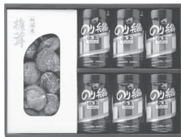
田吾作セット 2,160円～5,400円