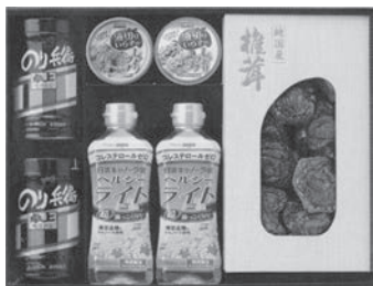
桃太郎セット 2,160円～5,400円

しいたけ・焼のり・味付のり・かんぴょう・日高昆布・ひじき・きくらげ・きなこ・お好み焼の素・お好み焼ミックス粉